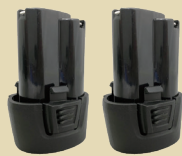
バッテリーパック (2) SI-B1207LA