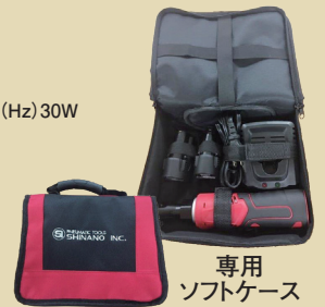
専用 ソフトケース