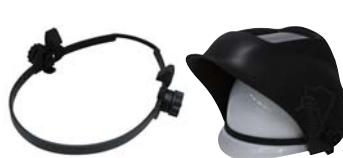
[ヘルメット取付アダプター]

P-567(1.5度/1枚入) P-568(2.0度/1枚入) P-569(2.5度/1枚入)