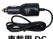
車載用 DC 12V 車・24V 車 兼用アダプター