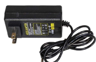
家庭用 AC100V アダプター