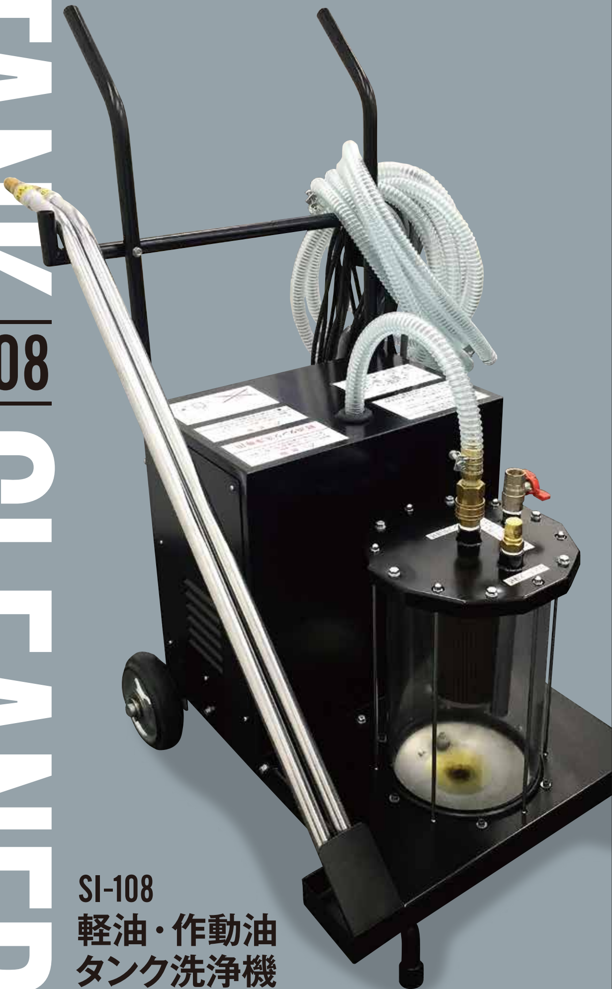
SI-108 軽油・作動油 タンク洗浄機