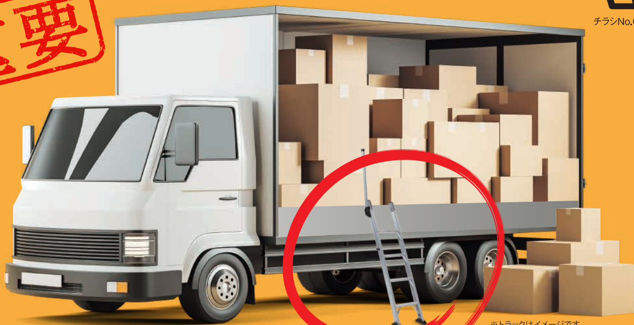
※トラックはイメージです。